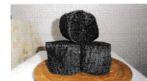
菊のような割れ目が美しい菊炭