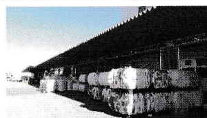
回収されたトレーなどの塊