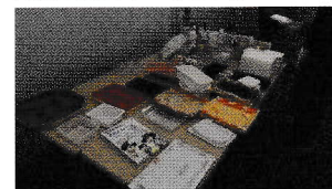
リサイクル後のエコトレー