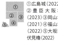
① 広島城(2022) ② 豊臣大阪(2023) ③ 岡山(2021) ④ 福山(2022) ⑤ 大坂伏見櫓(2022)