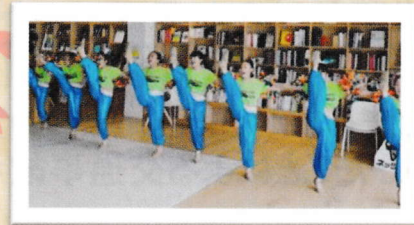
チアダンスチーム「S·H·A·R·E」😊

「チームいがき」プロフィール 尼崎を拠点に活動しているよさこい鳴子踊りのチームです。孫世代から祖母世代までの幅広い年齢層で、笑顔・元気をモットーに、ただただ、よさこい鳴子踊りを楽しんで練習しています。