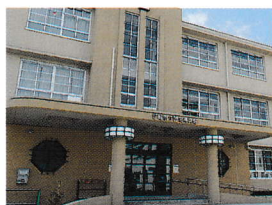
尼崎市立歴史博物館