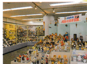
世界の貯金箱博物館