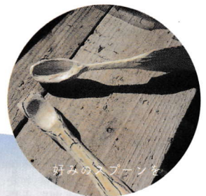
好みのスプーンを