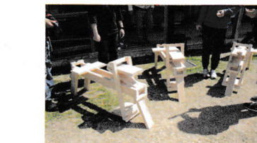
昨年みんなで作った削り馬。これにまたがって木を削ります。

6月には間伐してきた木で、思い思いの道具を作る企画などナイフだけでできるクラフトに挑戦するなど、尼崎の森でGWWがちょっと盛り上がるというなど、この冬の森の会議はビギナー向けの練習会を企画しています。