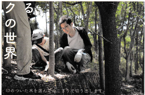
印のついた木を選んでのこぎりで切り出します。

森づくりに欠かせない間伐材では、たくさんの間伐材が生まれます。これを使った新しいアクティビティを考えよう、森の会議ではこれまでロケットストーブを使った豚汁づくりや燻製(くんせい)の練習などに取り組んできました。