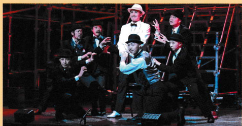
第75回公演 ピッコロシアタープロデュース「三文オペラ」

■主な受賞歴 ●平成9年度文化庁芸術祭賞(演劇部門)優秀賞 ●第32回紀伊國屋演劇賞団体賞 ●平成10年度尼崎市市民芸術賞特別賞 ●平成19年度文化庁芸術祭賞(演劇部門)優秀賞 ●平成25年度文化庁芸術祭賞(演劇部門)優秀賞 ●令和3年度文化庁芸術祭賞(演劇部門)大賞(ほか)