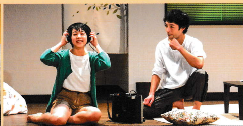
第77回公演「スターマン」

原作=岡田 淳(理論社刊) 台本=秋浜悟史 (2023年) 演出=平井久美子(ピッコロ劇団) 音楽=園田容子 8月・12月