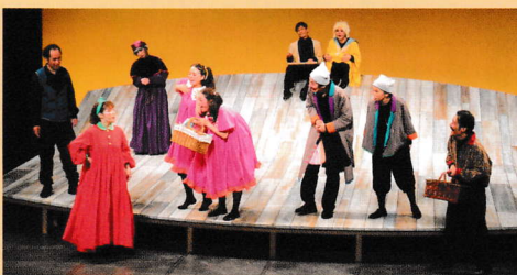
ファミリー劇場 「森のなかの海賊船～こそあどの森の物語～」

作=プレヒト(谷川暎子訳 光文社) (2023年2月) 台本・演出=松本修(MODE)