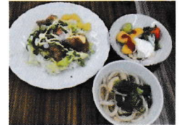
作りたてがおいしい♪