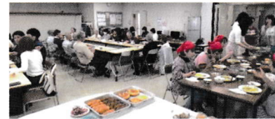
おしゃべりしながら楽しくお食事

【予約】 090-1148-3549 (小川) 予約受付は、第2(月)9:00~から。定員になり次第終了。