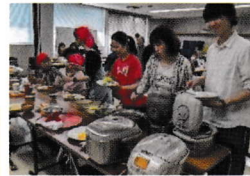
おかわりOKのものも!?

活動日 第3(月) 12:00~14:00 ※祝日の場合はお休み 活動場所 協同購入センター宝塚 組合員集会室 (宝塚市伊子志4-7-30) 参加費 300円(大人・高校生以上)、100円(子ども) 問い合わせ 第1地区本部