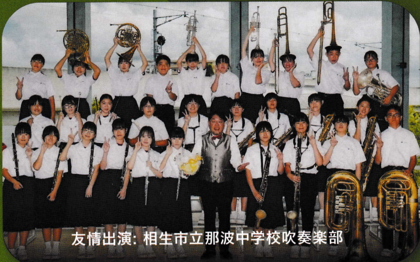
友情出演: 相生市立那波中学校吹奏楽部

(ご来場にあたってのお願い) ・状況により、公演内容等急遽変更する場合がございます。 ・その他、事前に会場ホームページの「大切なお知らせ」「お客様へのお願い」をお読みの上ご来場ください。