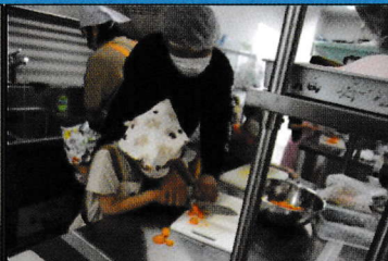
5月11日(土) 昼食会「和食セットをつくろう!」