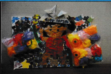
5月10日(金) ちいちゃんのえほんひろばとこいのぼりを作ろう!!