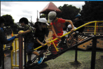
4月27日(土) MAPPY(笹原公園に行こう!)