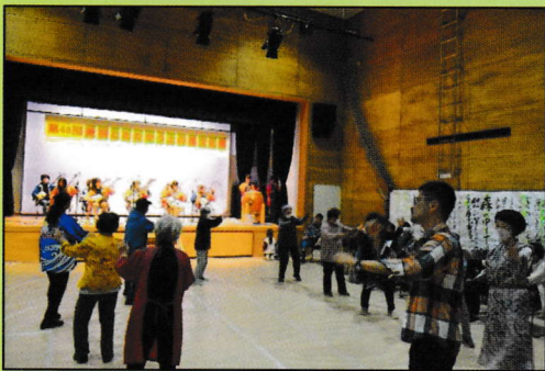
「一夜こら」を踊る参加者のみなさん(第48回)

今年で 49 回目を迎える「差別とたたかう上の島文化祭」。例年 5 月頃に実行委員会を立ち上げ内容の検討と実施・反省会を実施しています。実行委員会は、立花中学校・立花小学校・いくしま人権協会・上ノ島福祉協会(育友会・女性会含む)・南塚口町農会・部落解放同盟上の島支部(青年部・女性部含む)等、学校や地元の各団体と当センターで構成されています。