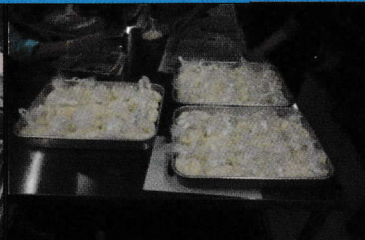
5月15日(水) ごきぶりホウ酸団子作り講習会