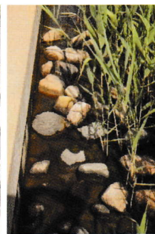
人工干潟の葦(ヨシ)が水中の栄養分を吸収