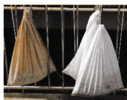
藻を採取して天日干し