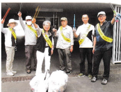
黄色のタスキが目立ってます