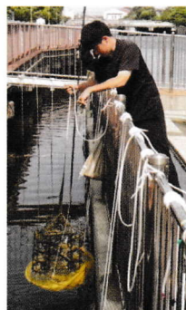
小魚の住みかを手作りして調査