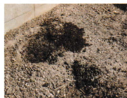
藻や貝殻をたい肥に