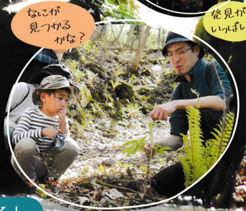
なにが見つかるかな？