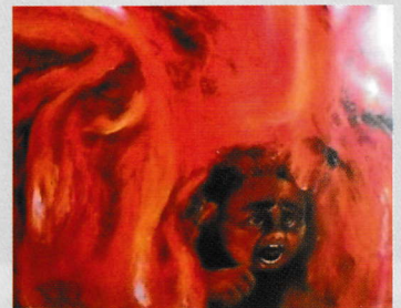
ヒロシマの高校生が描いた原爆の絵 「炎の中で助けを求める女の子」

23日(金) 平和紙芝居 (子どもも大人も) (2F 学習室1) (午前中随時)