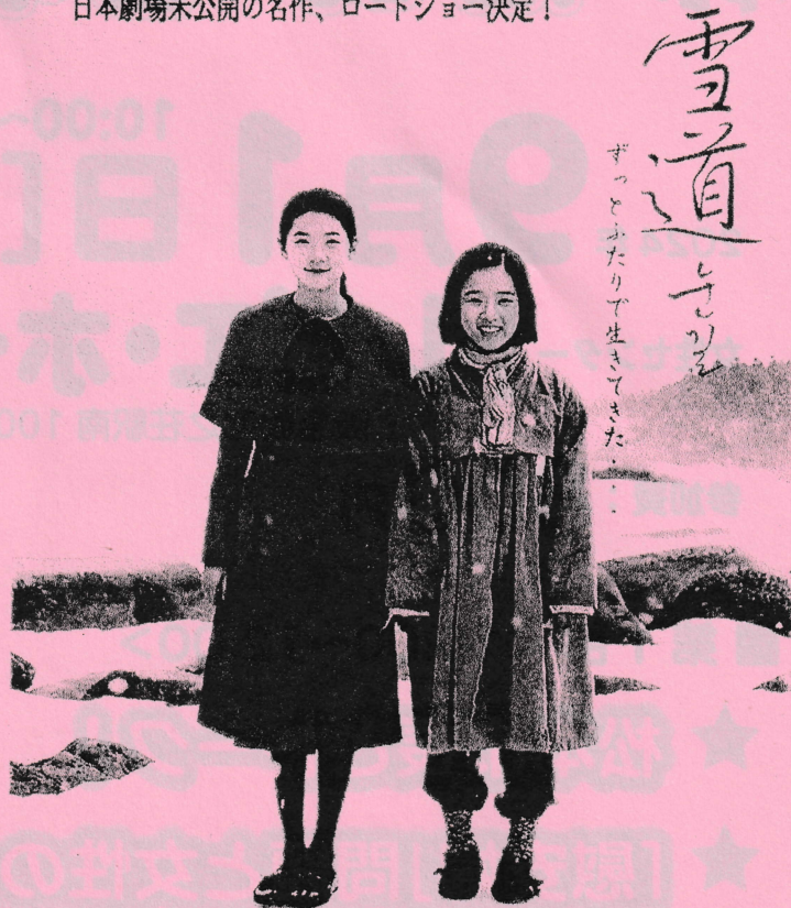
キム・セロン キム・ヒャンギ