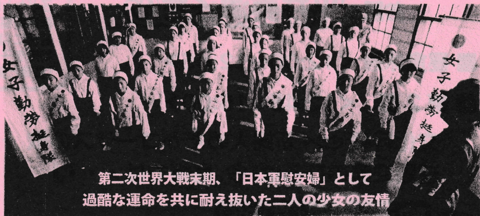
第二次世界大戦末期、「日本軍慰安婦」として 過酷な運命を共に耐え抜いた二人の少女の友情