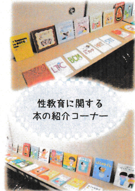
性教育に関する本の紹介コーナー

今、書店ではたくさんの「性教育」の本があります。小さい子向けの絵本から小学生、思春期向けなどさまざまあるので、一度手に取ってみてはいかがでしょうか。