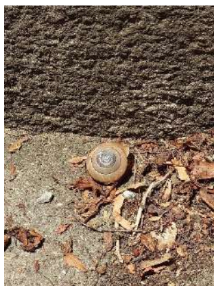
この夏、奈良・吉野で見かけたカタツムリの殻

私の感性が鈍ったからなのか、意識や行動範囲が変わったからなのか、環境の変化なのか、それとも気のせいかなど、ぐるぐると考えていたら、「カタツムリ、どこへ?」近畿では半数が絶滅危機―市街地化や乾燥原因と識者(時事通信、2024年7月13日配信)という記事を発見。記事では、減少の要因の一つとして「乾燥化」を挙げていて、「都市部の公園などでは落ち葉や朽ち木が除去されるのが多く、『隠れる場所がなくなっている』と指摘する」との一文が。そういえば、私が小学生時代、身近には木々や草でうっそうとして、落ち葉が年中積もったままになっている公園が街中にもいくつもあったよう。防犯や環境整備、安全などさまざまな理由から、そういった公園を今はあまり見かけないように思いました。