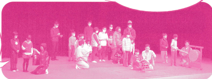
お囃子体験のようす

お囃子体験をはじめ、 落語を子どもと楽しむ という企画自体が面白 く新鮮。一緒に参加し た孫も喜んでました。 (一般)