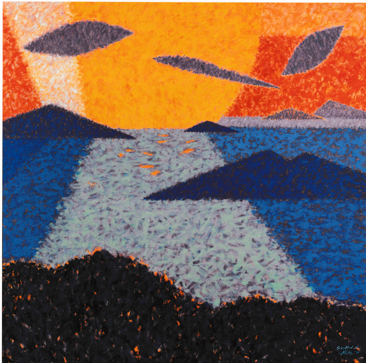
《ソロモンIII》1986年 尼崎市蔵