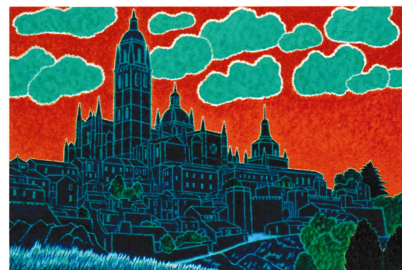
右 (SOLOMON) 1988年 (あすか) 1992年 (セピア眺望) 2002年 左 (樹間) 1987年 (あすかII) 1993年 ※全て尼崎市所蔵の赤羽恒男作品